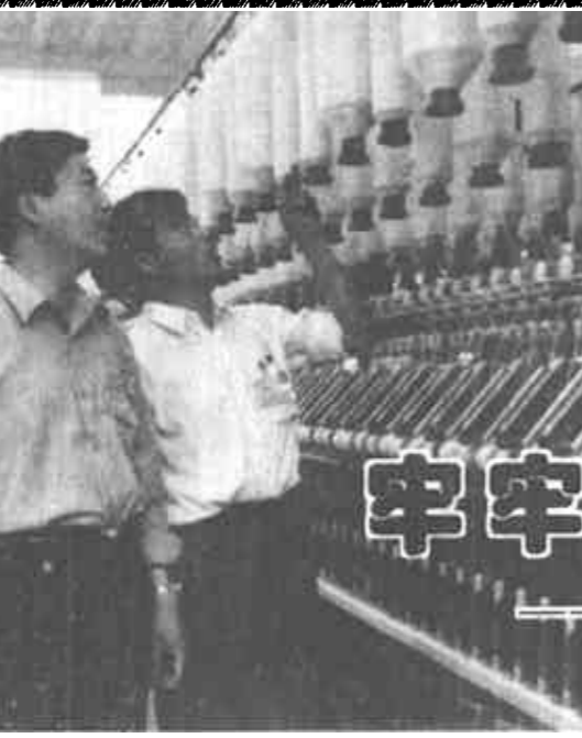
进入市棉纺织厂厂区大道,一幅横挂厂区上空的红字大标语映入眼帘:“视今天为落后,企业管理永无止境”。

最近一天凌晨1时,风雨交加。归心似箭的3位台胞在西刘桥派出所“110”报警服务台求助。西刘桥派出所“110”值班室接到县局指挥中心指令后,所长马福永立即带领4名干警以最快的速度赶赴出事地点,将车拖上来。此时,已是凌晨2点多钟了。(王成功 李忠亮)