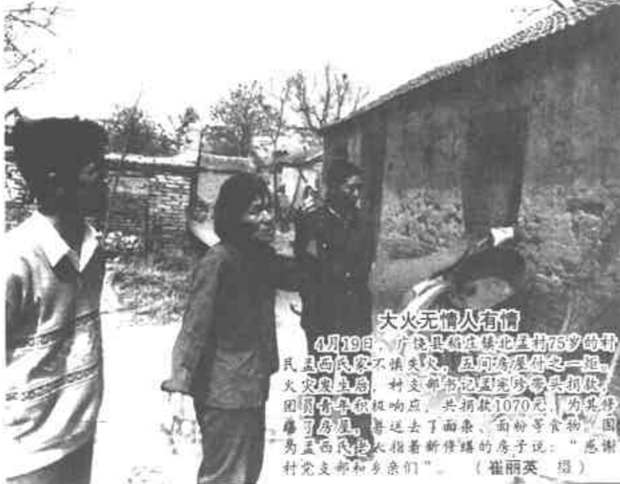
大火无情人有情 4月29日,广饶县魏集镇75岁的魏某因不慎失火,压向油路旁的一堆柴草,引发火灾。村支书闻讯后及时组织村民帮助灭火,共捐款1070元,为其修房、修路,并送去面粉等食物。图为魏某指着新建的房子说:“感谢村支两委和乡亲们”。